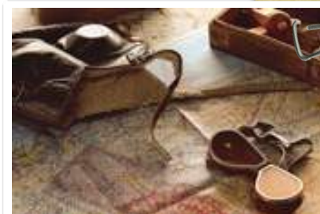
Suivre à la lettre toutes les étapes pour réussir le challenge!

3. Préparer le débat du mardi avec Twitter en postant une question pour les intervenants. Rappelez-vous, ce qui est posté sur Twitter est visible par tous, et pour longtemps. Apprenez à gérer votre identité digitale :)